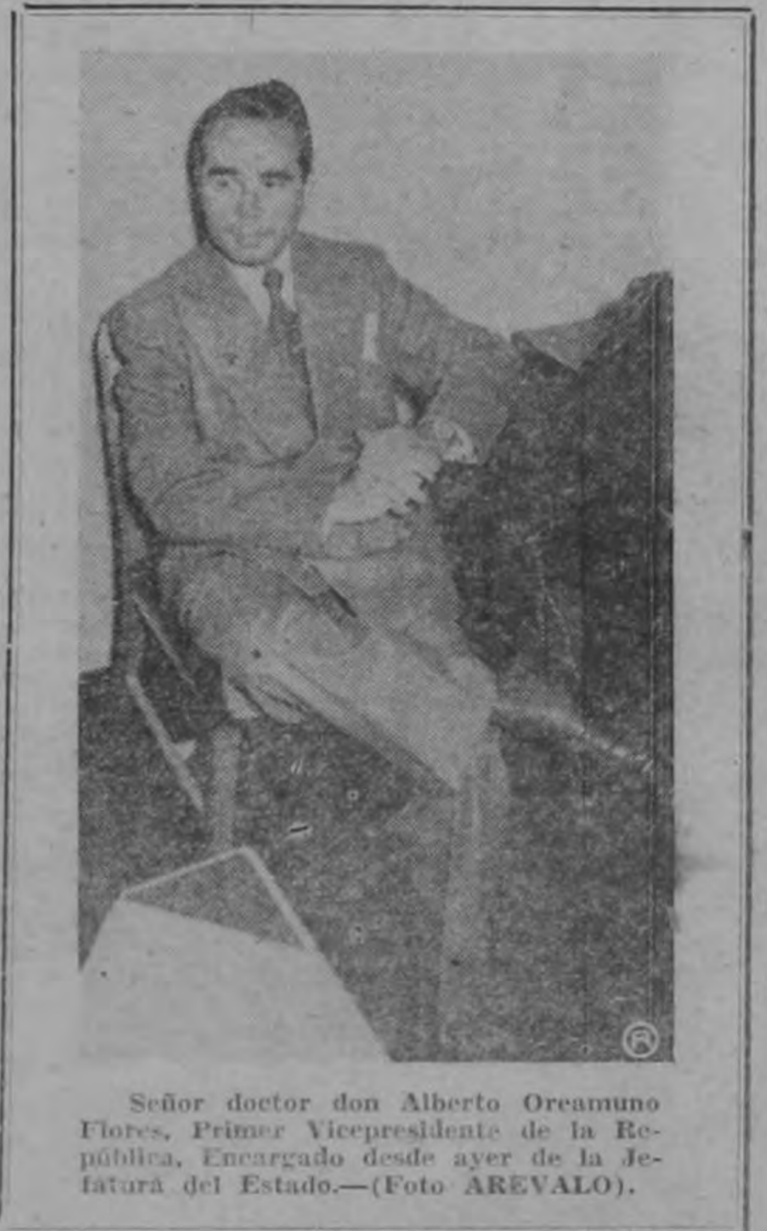
Señor doctor don Alberto Oreamuno Flores, Primer Vicepresidente de la República, Encargado desde ayer de la Jefatura del Estado.