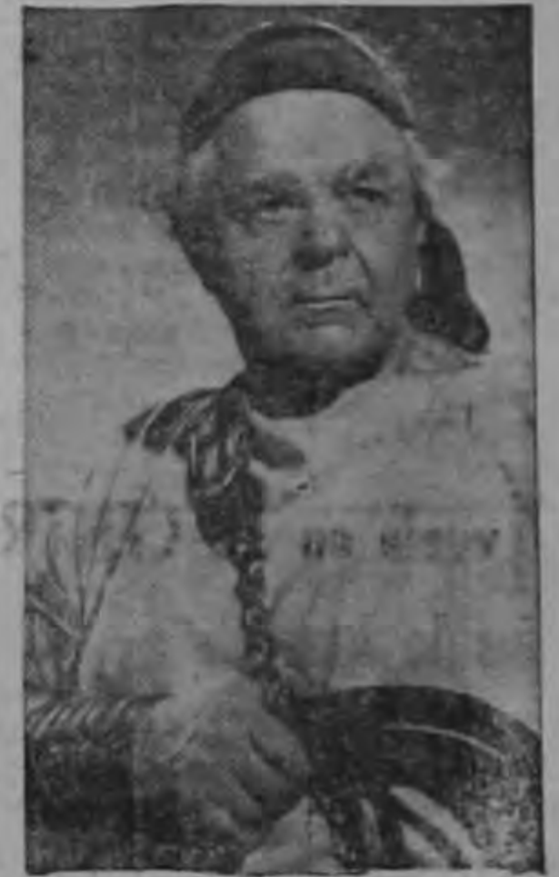
EL GUARDA DE LOS LEONES. Gene Lockhart, que es el encargado de la casa de fieras del Emperador romano en la producción de Gabriel Pascal basada en la clásica comedia de Bernard Shaw, "Androcles y el León", distribución de la RKO Radio, tiene un papel en contraste agudo con el de capitán de marina mercante en la producción de Huntington Hartford, "Secreto Compartido", primer episodio del film "De Hombre a Hombre", que también distribuye la RKO Radio Lockhart, hace años, ganó popularidad como autor de la canción "El Mundo Aguarda por el Amanecer".