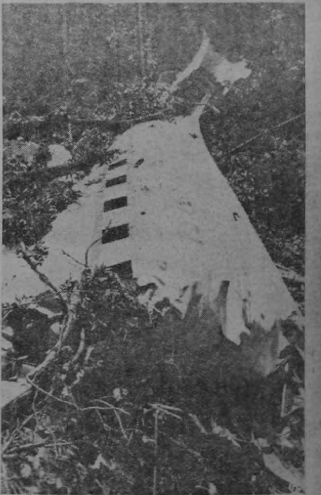
Veinticuatro horas después del accidente, nuestro fotógrafo Víctor Manuel Solano impresionó esta precisa placa; que es una síntesis del drama. Una sección del fuselaje resultó totalmente destruida, mientras que el resto sufrió pocos daños, y, más aún, la fuerza del impacto dobló las planchas, de manera que se formó una especie de defensa metálica, a lo cual es probable que debieran la existencia los sobrevivientes.—(Fotos SOLANO).

El viaje, según los datos que se han dado, se efectuará mañana a las ocho de mañana.