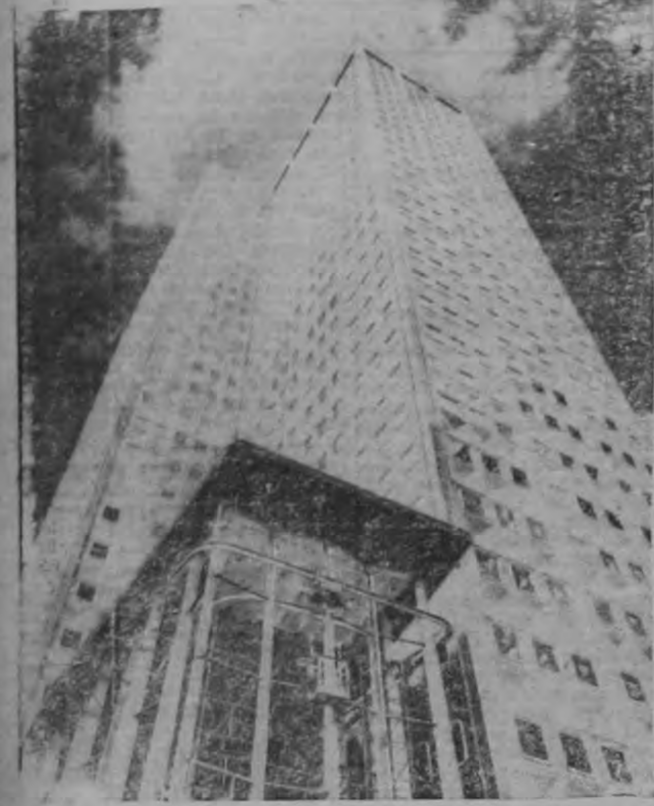
El edificio Alcoa parece echar hacia atrás su deslumbrante cúpula por encima de Pittsburgh.

Otra de sus características más notables es su entrada que tiene 4.5 mts. de altura construida de arriba a abajo. Dos enormes viguetas o ménsulas, sujetas al nivel del quin o piso, sostienen la entrada que consiste casi por completo de grandes planchas de vidrio. Haciendo por separado la entrada al edificio de la estructura principal, se pueden conservar intactas las líneas de toda la torre.